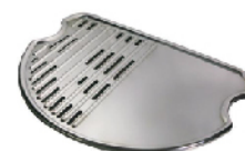
Решетка 3000-планча (многослойный металл, патент) для O-Grill 600, 700, 800T