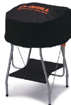
Чехол O-Cover для O-Grill 500, 600, 700, 800T