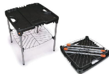
Стол O-Dock Lite