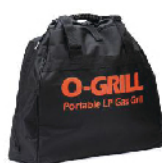
Сумка Carry-O 500 для O-Grill 500