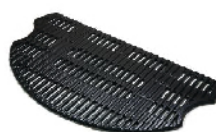
Решетка 1000-С (чугун) для O-Grill 500