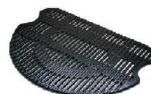
Решетка 3000-С (чугун) для O-Grill 600, 700, 800T