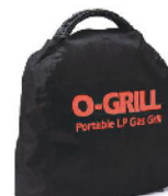
Чехол Cover-700 для O-Grill 600, 700, 800T