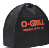
Чехол Cover-500 для O-Grill 500