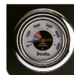
O-GRILL800T с термометром