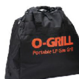
Сумка Carry-O 700 для O-Grill 600, 700, 800T