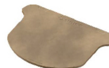
Пластина для пиццы 700 (камень кордиерит) для O-Grill 600, 700, 800T