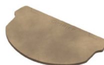
Пластина для пиццы 500 (камень кордиерит) для O-Grill 500